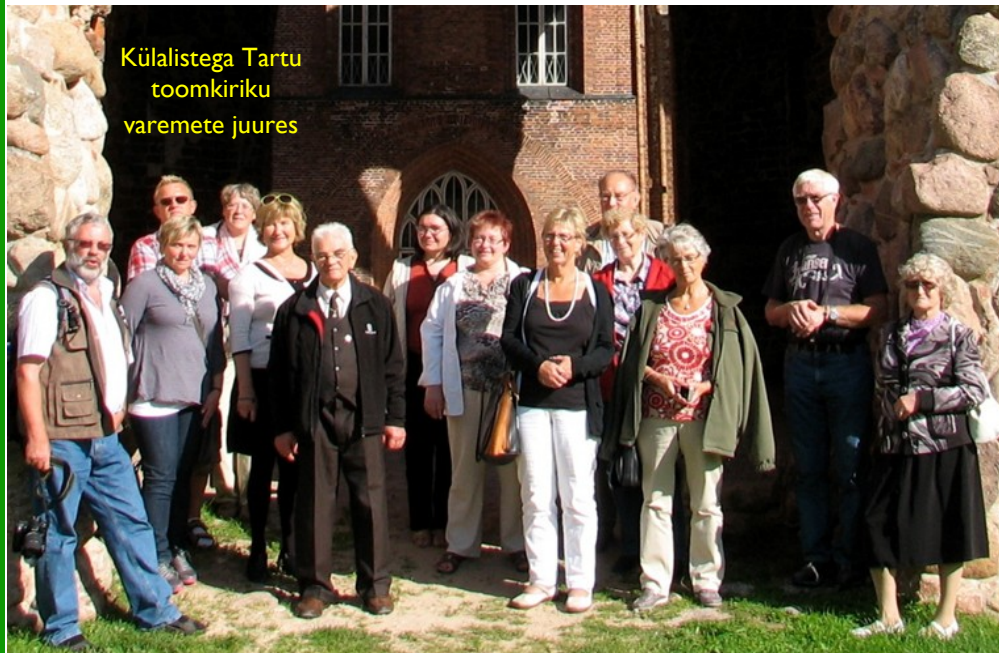
Külalistega Tartu toomkiriku varemete juures

Kuu aja eest külastas meie kogudust 10 diakooniarühma liiget Norra Nesi ja Sauheradi kogudusest. Meie diakooniarühm veetis külalistega kaks sisutihedat päeva.